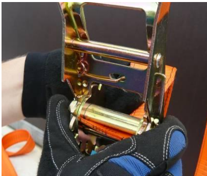
Abb. 2: Einführen des Gurtbandes