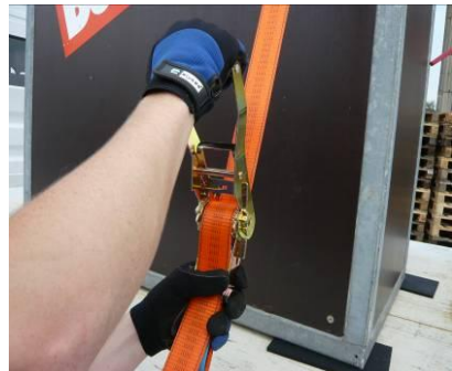
Abb. 5: Öffnen der Ratsche durch Ziehen des Fingerschiebers und Umschwenken des Handgriffs in 180° Stellung. Herausziehen des Gurtbandes