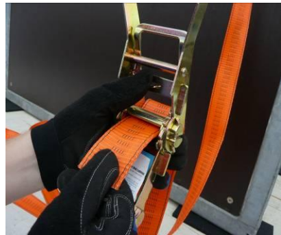
Abb. 3: Per Hand auf die gewünschte Länge festziehen.