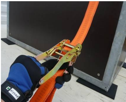
Abb. 4: Spannen durch Auf- und Abwärtsbewegungen des Handgriffs, bis die gewünschte Vorspannkraft erreicht ist. Ratsche nach dem Spannen schließen